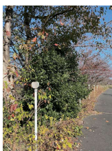
河岸の草が 自治会で処理 できないほどに！ →河川を管理する 県に相談中