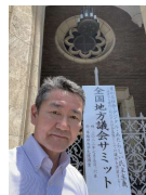
地方議会 サミット