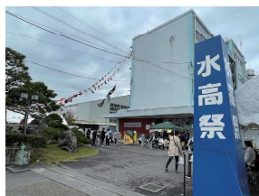
水高生の研究成果 などを見学