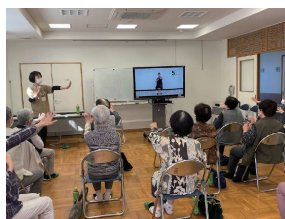
ミニデイでお年寄り と一緒に「ころばん体操」