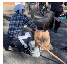
餅つき大会で 町内の方と交流