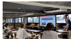
タウンミーティング