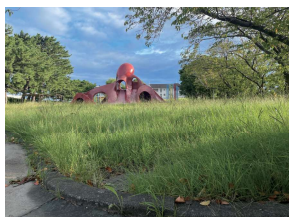
タコ公園に草が茂って孫が遊べない！ →担当課に依頼し10日後に綺麗に

ご相談があればすぐに現場を調査確認し、市役所担当課へ連絡して解決に向けた活動をしています。すぐに解決につながるものもあれば、時間をかけて要望していくこともあります。気になることがあったらどんなことでもご連絡ください。また日々の活動として、様々な地域や世代の方からお話を聞くため、各種イベントやミニデイなどに積極的に参加させていただいています。