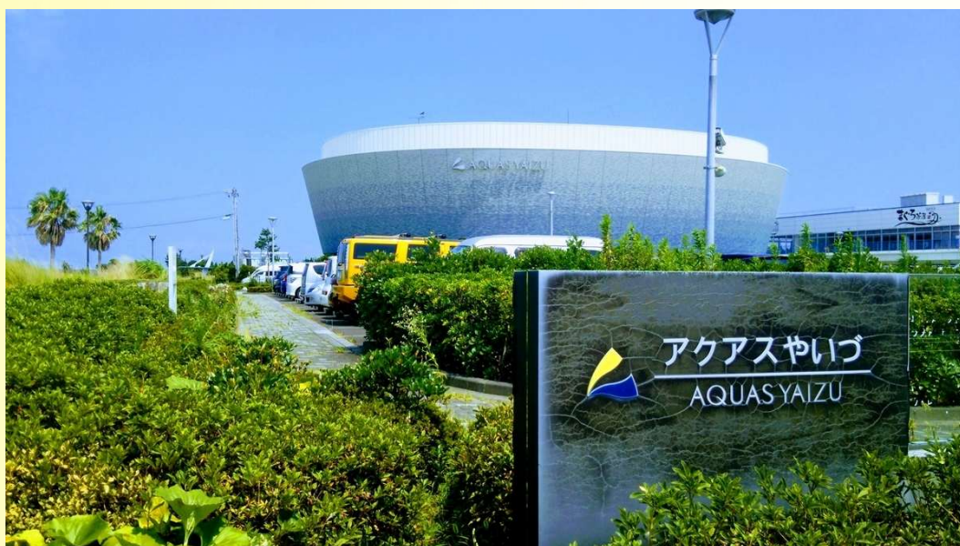
海洋深層水ミュージアム