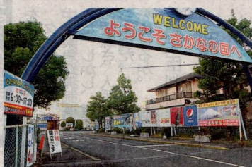
移転が検討されている焼津さかなセンター。6日午後、焼津市

「アクアスやいづ」や親水広場ふいしゅいな西側に位置する約3・4畝の市有地。運営する第三セクターの焼津水産振興センターが施設の整備を担うパートナー事業者の募集を開始した。2026年1月下旬まで